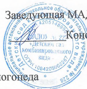
График работы учителя - логопеда